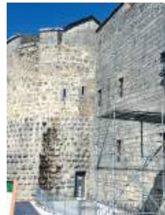
Travaux de reconstruction de la façade du bâtiment 52 en 1905