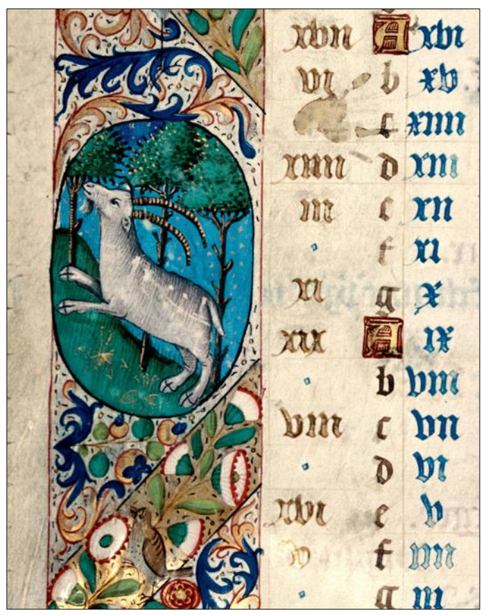
Breviary à l'usage de Besançon