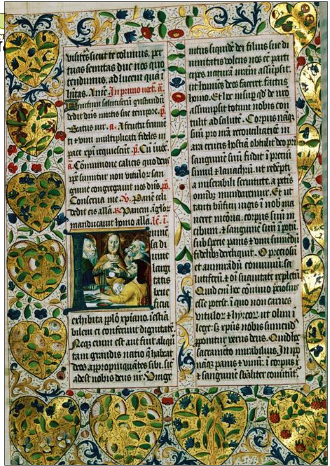
Breviary à l'usage de Langres