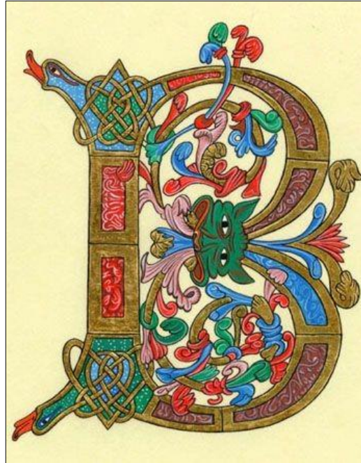
Lettre enluminée « B »