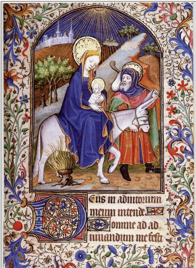
Fuite en Egypte

La liturgie des Heures est une prière quotidienne chrétienne, répartie en plusieurs moments de la journée, appelés offices .